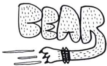
01. Un nounours. Pilosité et surpoids encouragés.

Combien de fois nous a-t-il fallu expliquer un mot apparemment simple à des hétéros qui nous observent avec de grands yeux? Chaque communauté a ses rites et ses codes. Chez nous, c'est une maladie: on crée des étiquettes comme d'autres produisent des croissants.