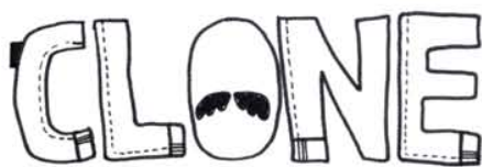
02. Un homme qui travaille sa virilité. Dans la version vintage de 1978, ça donne: moustache, barbe, gym, jeans 501, tee-shirt blanc et chaussures Red Wing.