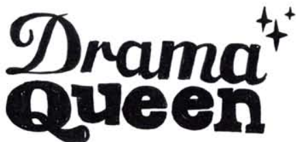
04. Ceux et celles qui font du drame un style de vie. Il faut toujours que ça soit plus intense, tu vois.