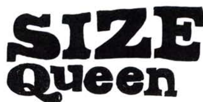
09. Ceux pour qui la taille du kiki compte plus que tout. Se dit parfois: «Il y a deux sortes de gays, les size-queens et les menteurs.»