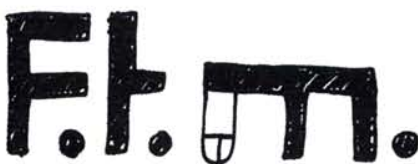
11. Female to male : littéralement, les femmes qui deviennent des hommes. L'exemple le plus frappant en est Buck Angel, un acteur porno qui a tous les attributs de la virilité mais une chatte entre les jambes.