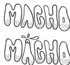
12. Le premier mot générique pour un gay viril.