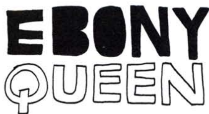
07. Un homme qui aime les Blacks.