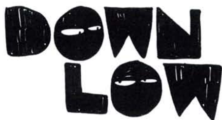
10. Ou DL. Se dit des Noirs, Beurs ou Latinos qui ont une sexualité gay sans l'assumer. Évidemment, il y a des gays DL en France. Voir la nouvelle série américaine qui traite du sujet: www.dlchronicles.com .