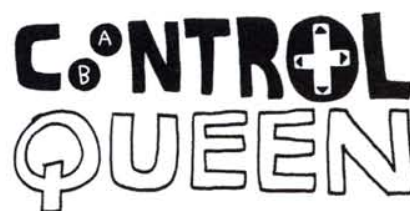
06. Un gay ou une lesbienne qui décide de tout et qui a du mal à fonctionner sans tout contrôler.